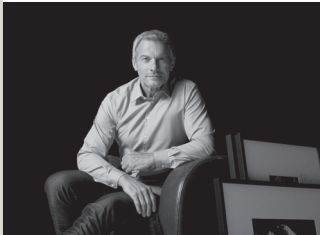
MARIE MUSTERMANN „UNTITLED IV“, 2013 (ABZUG: 2015) 80 X 120 CM C-PRINT (FUJI CRYSTAL DP II) UNTER ACRYLGLAS AUF ALUDIBOND

Dies ist der Abzug Nr. 2 aus einer limitierten Auflage von 25 Exemplaren. Die Auflage umfasst 15 Abzüge im Format 40 x 60 cm und 10 Exemplare im Format 80 x 120 cm sowie 2 Artist's Prints.